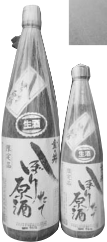
栗原限定 しぼりたて原酒