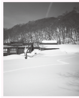
雪に埋まる湯浜温泉

本音を隠したがる、駄目だ と判断したらすぐにあきらめ てしまう。プライドが高めで 神経質とも言われています。 良い面が表れると、頼れる兄 貴分、姉御肌で優れた直感力 を頼りに即行動に起こせる人 悪い面が表れると、外面は良 いけど本音が見えない神経質 な人となってしまうようです。 鳥インフルエンザで養鶏場 では大変な正月を迎えて居る ことでしょうか。一日も早く 終息する事をお祈りします。 酉年の人、そうでない人も 今年も頑張りましょう。