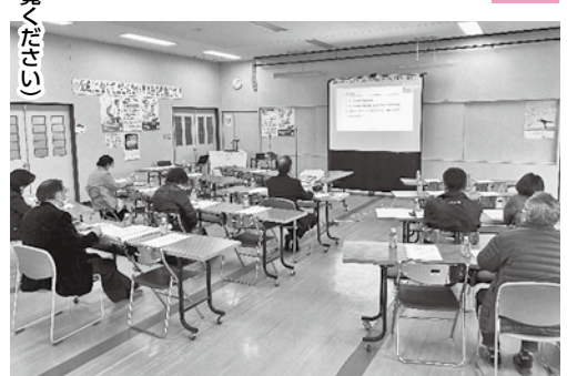
(最新の制度概要については、国税庁HPをご覧ください)

昨年同様オンラインによる開催となりましたが、講義では制度概要を分かり易く説明いただき、盛況のうち終了しました。